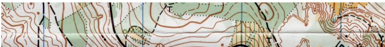
JWOC-deltagerne mødes af traditionelt kontinentalt terræn i Tjekkiet.