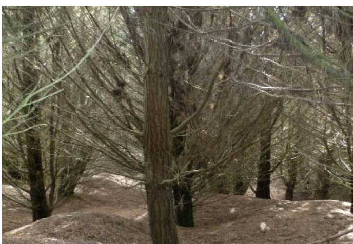
I New Zealand venter letløbte nåleskove...

Danmark havde 2 løbere i den samlede top 10 i 2012, hvor Maja blev nr. 8 og Ida nr. 9 – og Maja blev nr. 5 i 2011 og nr. 3 i 2010. Da Emma yderligere blev nr 16 i 2012 efter "kun" at have deltaget i 6 løb, skal det blive interessant at se om de kan forbedre deres placeringer yderligere. Hos herrerne blev Tue nr. 23 i 2012, hvor han imidlertid kun deltog i 7 løb – så han burde også have muligheder for at forbedre sin samlede placering.